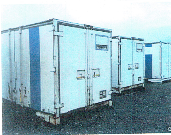
( 12ft/ 冷蔵コンテナ)